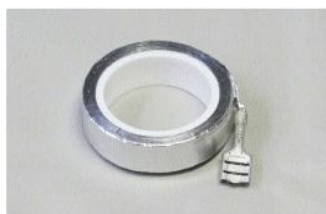
アルミ粘着リボンアンテナ