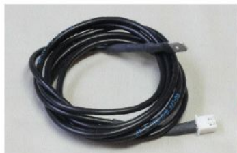
センサーハーネス