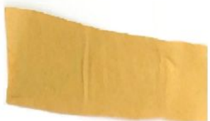
本体固定用粘着材