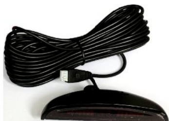
LEDディスプレイ&ハーネス