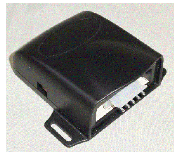
セキュリティタイマー本体